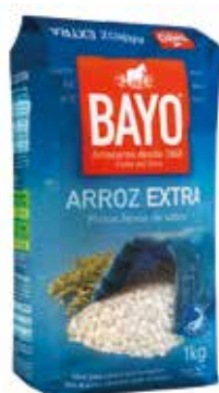
ARROZ EXTRA C/12 x 1 Kg. Ref.: 3700