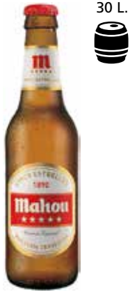
MAHOU 5 Estrellas C/24 x 1/3 Ret. Ref.: 492