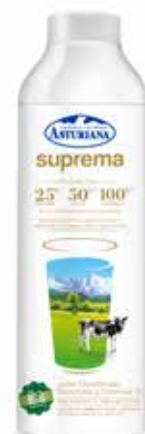
SUPREMA C/6 x 1 L. Ref.: 3504