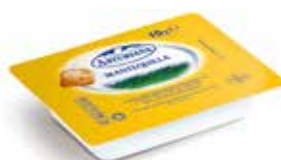
MANTEQUILLA MICROBARQUETA C/240 x 10 gr. Ref.: 3569