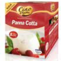
PANNA COTTA C/8 x 96 gr. Ref.: 3726