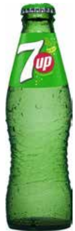
SEVEN UP C/24 x 0'20 Ref.: 416