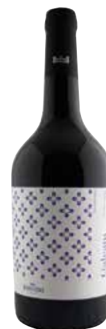
GALEAM Monastrell ref.: 3810