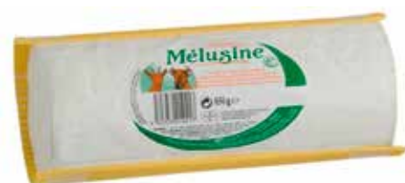
RULO MEZCLA 50/50 850 GRs.