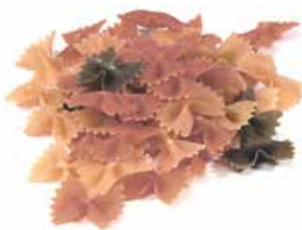
PAJARITA TRICOLOR Ref.: 3745 - 3 K.