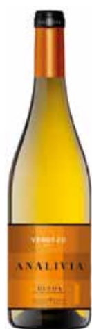
ANALIVIA Verdejo D.O. Rueda ref.: 3616