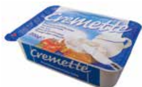
CREMETTE QUESO CREMA 200 G. Ref.: 3187