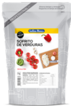
SOFRITO DE VERDURAS 1L (SABOR INTENSO) Ref.: 3711