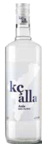
ANIS KÇALLA 1 L. Ref.: 1154