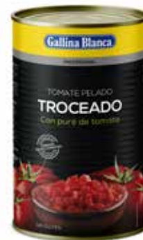
TOMATE TROCEADO C/3 x 4kg. Ref.: 1588