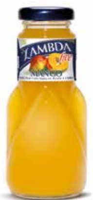
LAMBDA MANGO C/24 x 0'2 NR. Ref.: 2313