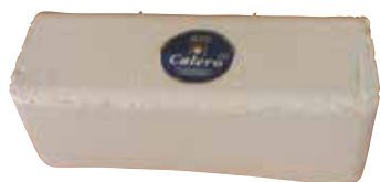
QUESO FRESCO MOLDE 1 KG Y BARRA 2 KG.