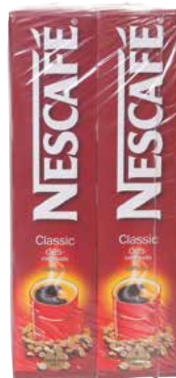
NESCAFÉ NESCAFEINADO Estuche 100 sobres Ref.: 428