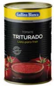
TOMATE TRITURADO C/3 x 4kg. Ref.: 1584