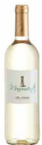
MONUMENTO ref.: 1856