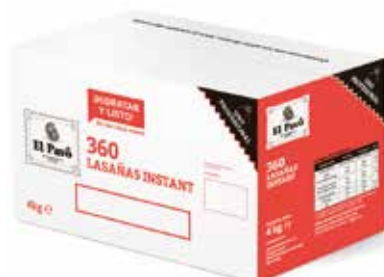
CAJA LASAÑA 360 PLACAS Ref.: 3716