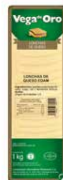
VEGA DE ORO EDAM LONCHAS 1 Kg. Ref.: 3306