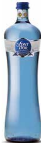
FONT D'OR MAXIMUM C/12 x 1L Ret. Ref.: 1075