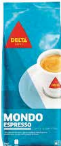
MONDO ESPRESSO 1 KG. Tueste natural Ref.: 2689 Tueste 80/20 Ref.: 2690