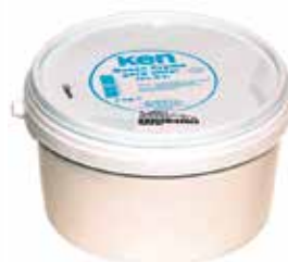
KEN QUESO CREMA 3 K. Ref.: 2178