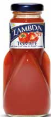
LAMBDA TOMATE C/24 x 0'2 NR. - Ref.: 2307 C/6 x 1L NR. - Ref.: 2305