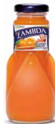
LAMBDA NARANJA-ZANAHORIA C/24 x 0'2 NR. Ref.: 2317