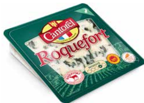
ROQUEFORT 100 GR.