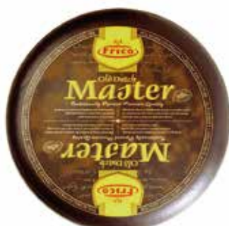
FRICO MASTER OLD DUTCH 5 K.