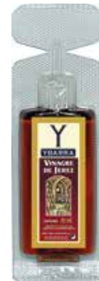
VINAGRE DE JEREZ C/200 x 10 ml. Ref.: 1670