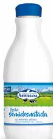
SEMIDESNATADA C/6 x 1'5 L. Ref.: 3600