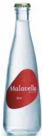
MALAVELLA C/20 x 1/3L Ret. Ref.: 2082 C/20 x 1/3L NR. Ref.: 2406