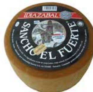
D.O. IDIAZABAL 3 K. Ref.: 3328