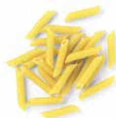
MACARRONES Ref.: 3719 - 5 K.