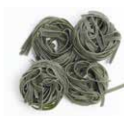
NIDOS ESPINACAS Ref.: 3740 - 3 K.