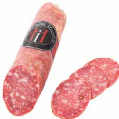
SALCHICHÓN IBÉRICO Ref.: 3246