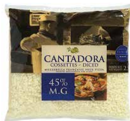
CANTADORA MOZZARELLA DADOS 2'5 K. Ref.: 3572