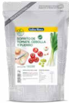
SOFRITO VERDURAS 1L (SABOR SUAVE) Ref.: 3752