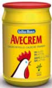
AVECREM 1 KG. POLLO Ref.: 3747