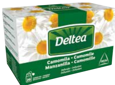
MANZANILLA Estuche 20 bolsitas Ref.: 1970