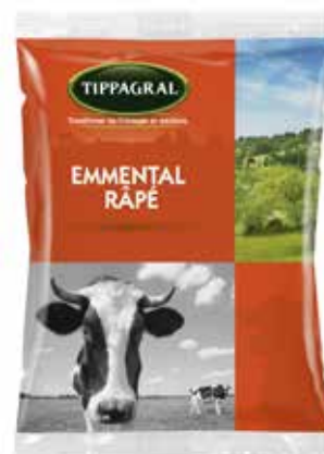
EMMENTAL RALLADO 1 K. Ref.: 252