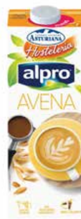
AVENA C/6 x 1 L. Ref.: 3066