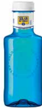
SOLÁN DE CABRAS