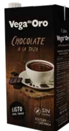
VEGA DE ORO CHOCOLATE A LA TAZA C/6 x 1L. Ref.: 3546