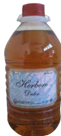
HERBERO DULCE 3 L. Ref.: 1951