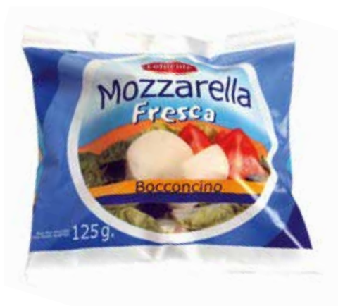
MOZZARELLA BOCCONCINO 125 GRS. Ref.: 2827