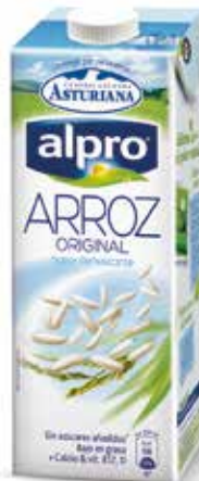
ARROZ C/6 x 1 L. Ref.: 3636