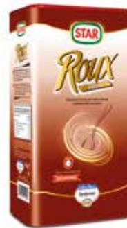
ROUX OSCURO GRANULADO 1 KG. Ref.: 3730