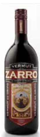
ZARRO VERMUT ROJO 1L. Ref.: 3765