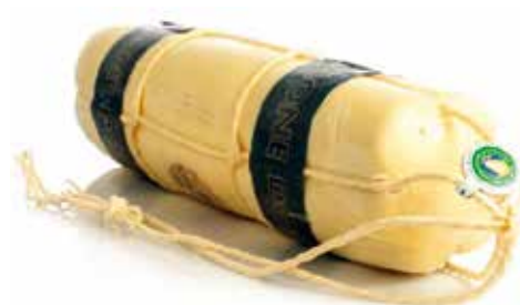
PROVOLONE 5 K.