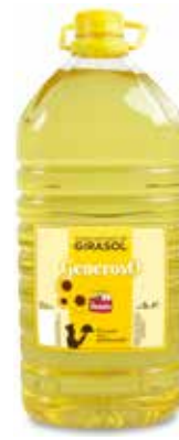
GENEROSO GIRASOL 5 L. Ref.: 1680