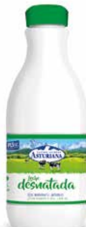
DESNATADA C/6 x 1'5 L. Ref.: 3601