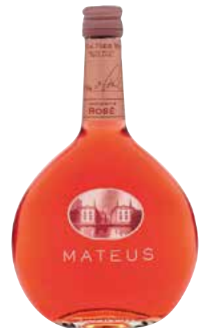
MATEUS Rosé ref.:693