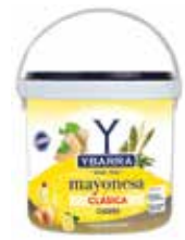
MAYONESA CLÁSICA YBARRA 5 L. Ref.: 596