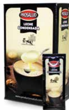
LECHE CONDENSADA SOBRES 30 Grs. Caja 40 unidades Ref.: 2368