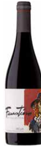
FAUSTINO Art Collection Tinto de Autor ref.: 661