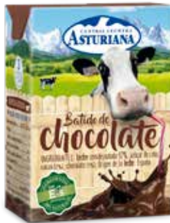
BATIDO MINIBRICK C/24 x 0'2 Ref.: 3537