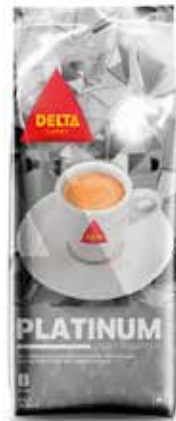
PLATINUM 1 KG. Tueste natural Ref.: 2688