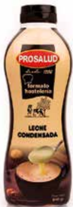
LECHE CONDENSADA SIRVEFACIL 840 Grs. Caja 6 unidades Ref.: 3052