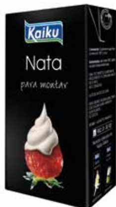
KAIKU NATA MONTAR 35% C/6 x 1 L. Ref.: 2466