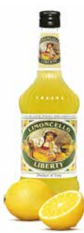
LIMONCELLO LIBERTY 0'70 L. Ref.: 1996