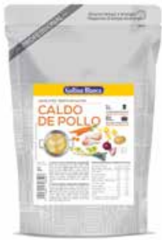
CALDO POLLO 1 L. Ref.: 3755