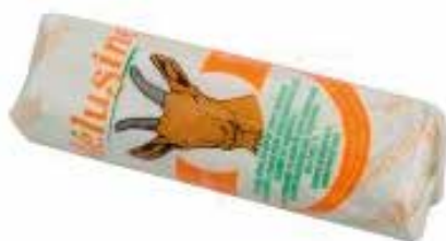
RULO CABRA 100% 180 G