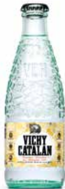
VICHY CATALÁN C/24 x 1/4 Ret. Ref.: 73