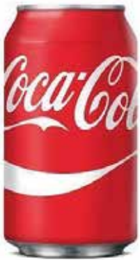
COCA-COLA C/24 x lata 33cl. Ref.: 814