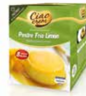
POSTRE FRÍO DE LIMÓN C/8 x 123 gr. Ref.: 3725