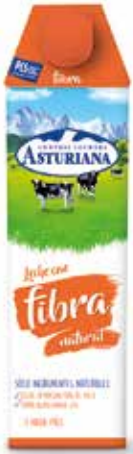
FIBRA C/6 x 1 L. Ref.: 3547