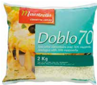
MAESTRELLA DOBLO 70/30 DADOS 2 K. Ref.: 3258