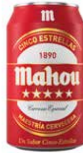
MAHOU 5 Estrellas C/24 x lata 33 cl. Ref.: 495