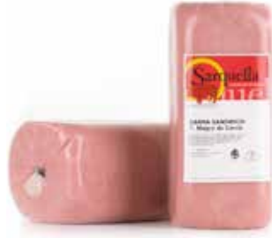
BARRA SANDWICH 11x11 Ref.: 2203