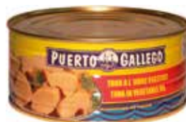
ATÚN LISTADO En aceite vegetal RO-1000 Ref.: 2559