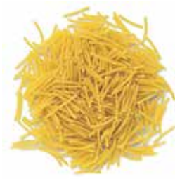
FIDEO 2 Ref.: 3721 - 5 K.