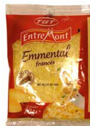
EMMENTAL RALLADO 70 G Ref.: 3135