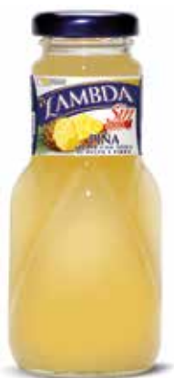
LAMBDA PIÑA C/24 x 0'2 NR. Ref.: 2316