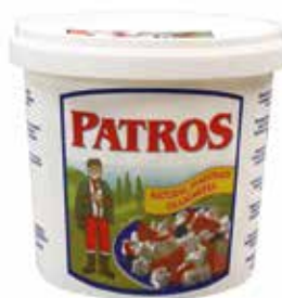
PATROS NATURAL EN SALMUERA 1 K. (Tipo feta) Ref.:3219