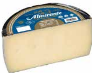
ALMIRANTE SEMI Mezcla 1/2 pieza Ref.: 1489