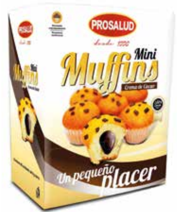
MINI MUFFINS CACAO Estuche 95 ud. Ref.: 1590