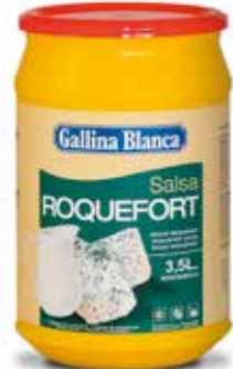
ROQUEFORT Ref.: 3738