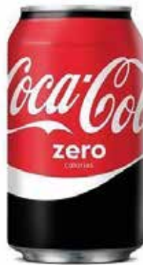
COCA-COLA ZERO C/24 x lata 33cl. Ref.: 2985