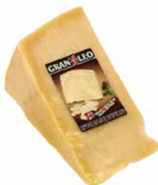
GRAN LEO 1,5 K.