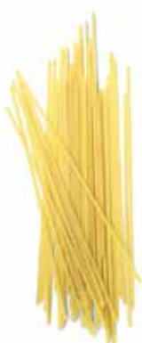
TALLARINES Ref.: 3718 - 6 K.