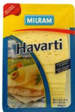
HAVARTI MILRAM 200 G. Ref.: 3290