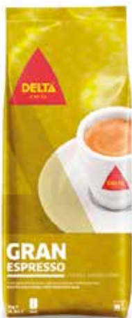
GRAN ESPRESSO 1 KG. Tueste natural Ref.: 1488 Tueste 80/20 Ref.: 2687