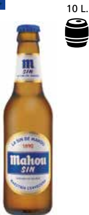
MAHOU SIN C/24 x 1/3 Ret. Ref.: 580