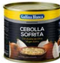
CEBOLLA SOFRITA C/6 x 2'5kg. Ref.: 1707