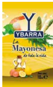
MAYONESA C/250 x 10gr. Ref.: 1654