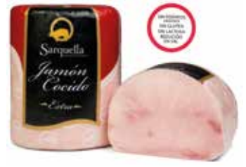
JAMÓN SIN FOSFATOS Ref.: 1473