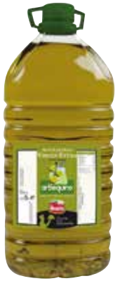
ARBEQUINO OLIVA VIRGEN EXTRA 5 L. Ref.: 1682