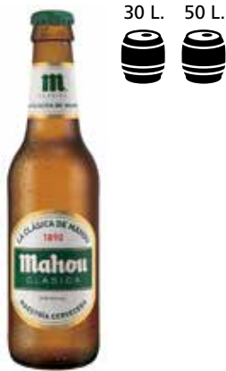
MAHOU CLÁSICA C/24 x 1/3 Ret. Ref.: 489