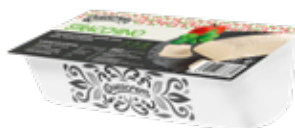
QUESCREM QUESO FRESCO MEDITERRANEO