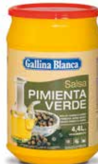
PIMIENTA VERDE Ref.: 3712