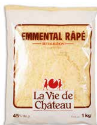
EMMENTAL RALLADO 1 K. Ref.: 3144