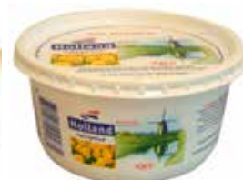
MARGARINA VEGETAL Tarrina 500 g. Ref.: 3196