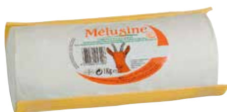
RULO CABRA 100% 1 K.