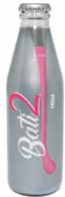
BATI2 FRESA C/12 x 0'2 Ref.: 3615