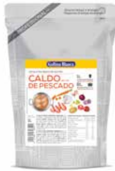
CALDO PESCADO ROJO 1 L. Ref.: 3744