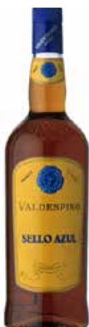
BRANDY SELLO AZUL 1 L. Ref.: 1995