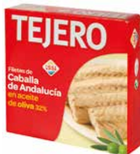
FILETES DE CABALLA En aceite oliva RO-550 Ref.: 1093