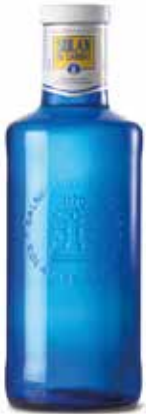
SOLÁN DE CABRAS