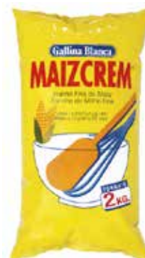
MAIZCREM 2 KG. Ref.: 3743