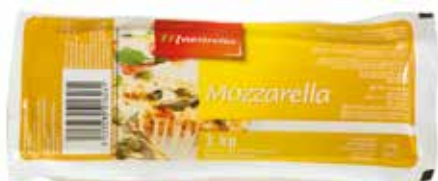
MAESTRELLA MOZZARELLA RULO 1 K. Ref.: 3239