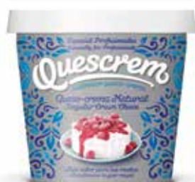
QUESCREM Crema Extragrasso cubo 2 KG. Ref.: 701