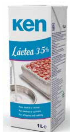
KEN LÁCTEA 35% C/12 x 1 L. Ref.: 1796