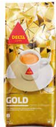
GOLD 1 KG. Tueste natural - Ref.: 1834 Tueste 90/10 - Ref.: 1833