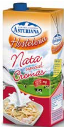
NATA ESPECIAL CREMAS 12% C/6 x 1 L. Ref.: 3522