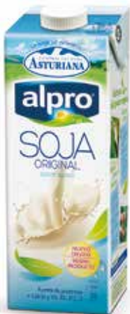
SOJA ORIGINAL C/6 x 1 L. Ref.: 3535