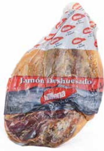
JAMÓN DESHUESADO Ref.: 3209