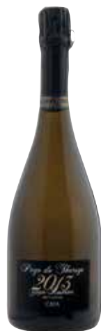
PAGO DE THARSYS Gran Reserva ref.: 932