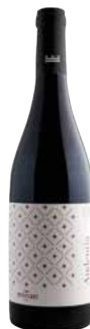
AUDENTIA Petit Verdot ref.: 3800