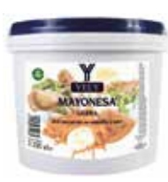
MAYONESA LIGERA YELY 3,5 L. Ref.: 1660