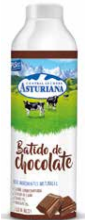
BATIDO CHOCOLATE C/6 x 1 L. Ref.: 3556