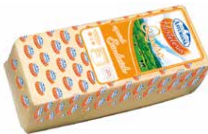
ASTURIANA BARRA 3 K. Ref.: 2938