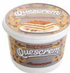
QUESCREM MASCARPONE 500 G. Ref.: 702