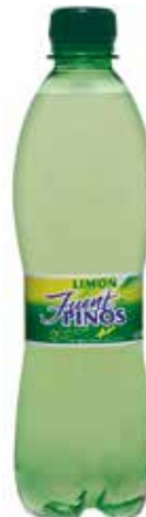
FUENTPINOS LIMÓN C/12 x 0'5 Pet Ref.: 204