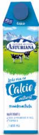
CALCIO DESNATADA C/6 x 1 L. - Ref.: 3513 CALCIO SEMI C/6 x 1 L. - Ref.: 3512