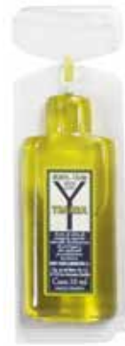
ACEITE OLIVA VIRGEN EXTRA C/200 x 10 ml. Ref.: 1669