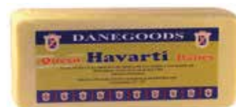
HAVARTI DANÉS 2 K. Ref.: 3141