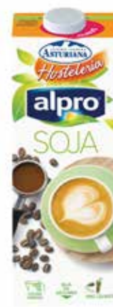
SOJA C/6 x 1 L. Ref.: 3552