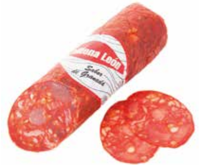
CHORIZO VELA Ref.: 3218