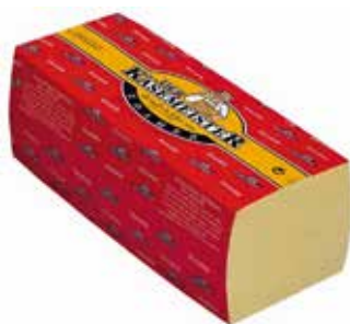
KASE MEISTER EDAM BARRA 3 kg. Ref.: 3375