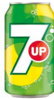
SEVEN UP C/24 x lata 33cl. Ref.: 2130