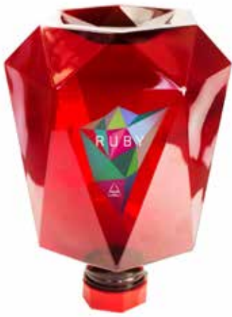
RUBY 3 KG. Tueste natural Ref.: 1835