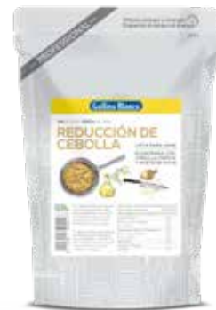
REDUCCION DE CEBOLLA 0'5 L. Ref.: 3748