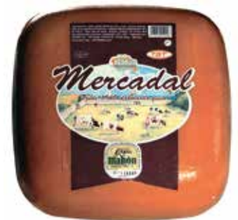
D.O. MAHÓN SEMI 3 K. Ref.: 3206