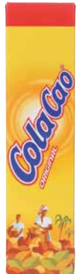
COLACAO Estuche 50 sobres 18 grs. Ref.: 1345