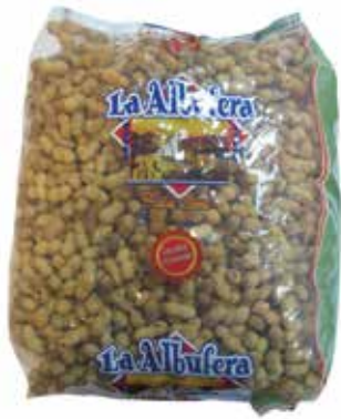
CACAHUETE CASCARA 3 Kg. Ref.: 5037