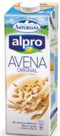
AVENA C/6 x 1 L. Ref.: 3516