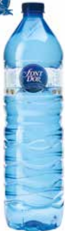
FONT D'OR C/12 x 1'5L Pet. Ref.: 1015 C/6 x 1'5L Pet. Ref.: 1018