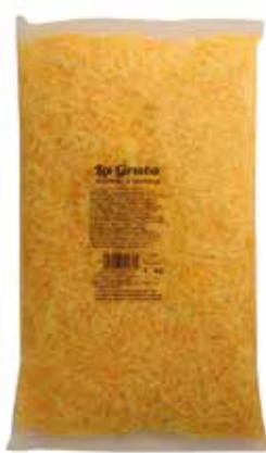
RALLADO 5 QUESOS 1 K. Ref.: 251