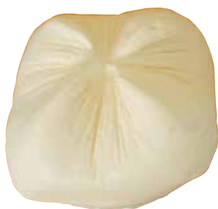
QUESO FRESCO SERVILLETA 500 GRS.