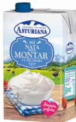
NATA MONTAR 35% C/12 x 0'5 L. Ref.: 3542