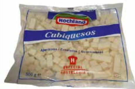
CUBIQUESOS 500 GRS. Ref.: 3207