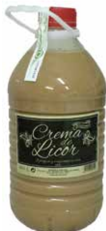
CREMA DE ORUJO 3 L. Ref.: 1053