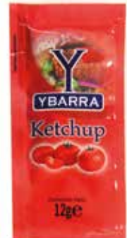
KETCHUP C/250 x 12 gr. Ref.: 1655