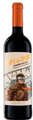
EL AVIADOR Tinta de Toro ref.: 1832