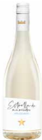
ESTRELLA DE MURVIEDRO Frizzante Blanco ref.: 5062