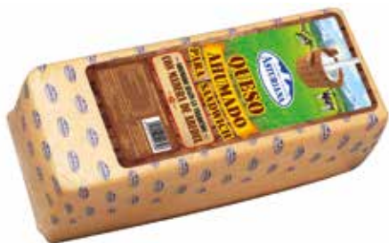
ASTURIANA BARRA AHUMADA 3 K. Ref.: 2939