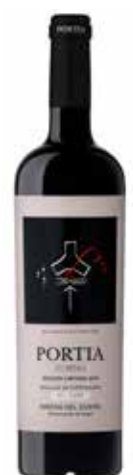
PORTIA Summa ref.: 684