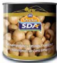
CHAMPIÑÓN LAMINADO. C/6 x 2'5kg. Ref.: 1629