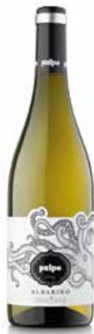
PULPO Albariño D.O. Rias Baixas ref.: 2915