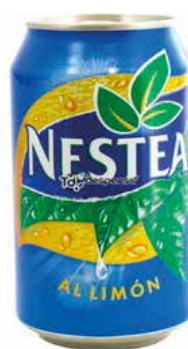
NESTEA LIMÓN C/24 x lata 33cl. Ref.: 2128