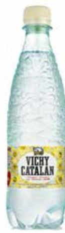
VICHY CATALAN C/24 x 0'5L Pet. Ref.: 146