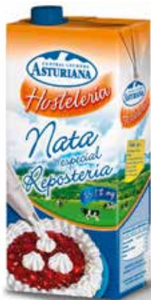
NATA ESPECIAL REPOSTERÍA 35% C/6 x 1 L. Ref.: 3523