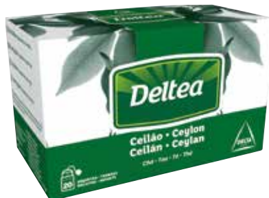
TE NEGRO Estuche 100 bolsitas Ref.: 923