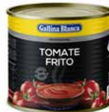
TOMATE FRITO C/6 x 2'5kg. Ref.: 1585