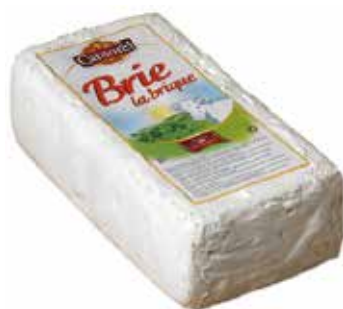
CANTOREL BRIE BARRA 1 K.