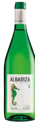
ALBARIZA Palomino Fino ref.: 1002