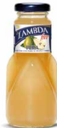
LAMBDA PERA C/24 x 0'2 NR. Ref.: 2311