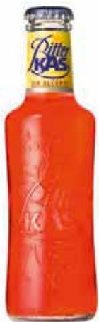
BITTER KAS C/24 x 0'2 Ref.: 154