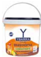
MAYONESA CONSISTENTE YBARRA 3,5 L. Ref.: 3628