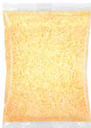
GOUDA RALLADO 1 K. Ref.: 250