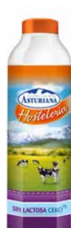
SIN LACTOSA CERO % C/6 x 1 L. Ref.: 3067