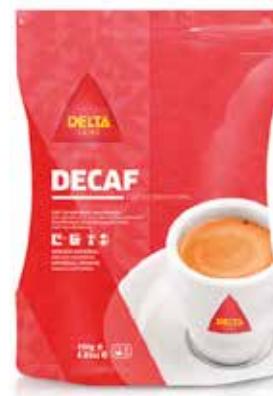
DESCAFEINADO MOLIDO 250 grs. Ref.: 1846