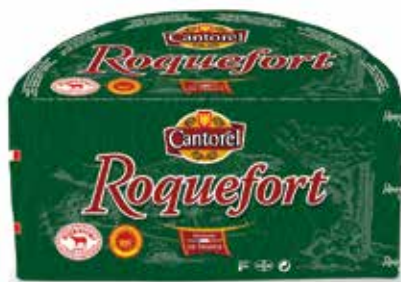
ROQUEFORT 1/2 PIEZA 1'5 K.