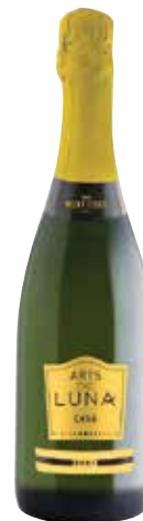
ARTS DE LUNA Brut ref.: 5018