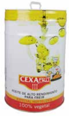
CEXAFRIT 10 L. Ref.: 1546