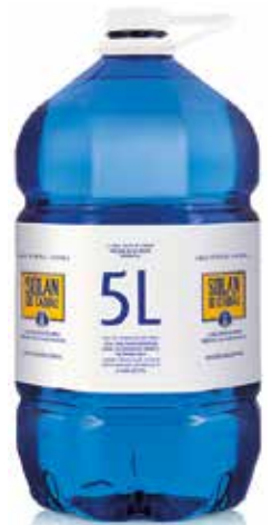
SOLÁN DE CABRAS