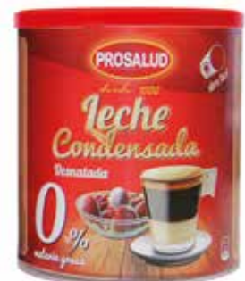
LECHE CONDENSADA DESNATADA 1 KG. Caja 6 unidades Ref.: 856