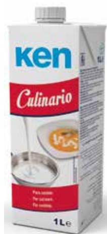
KEN CULINARIO C/12 x 1 L. Ref.: 1795