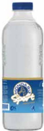
MONDARIZ SPORT C/12 x 0'5 PET Ref.: 201