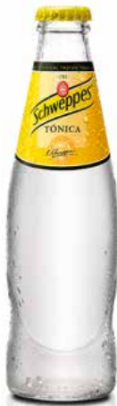
TÓNICA SCHWEPPE'S C/24 x 0'25 Ref.: 879