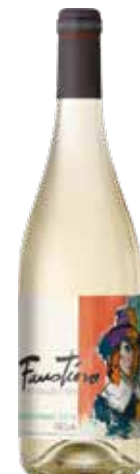
FAUSTINO Chardonnay D.O. Rioja ref.: 662