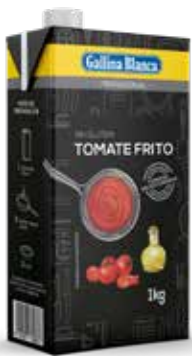
TOMATE FRITO C/6 x 1K. Ref.: 1576