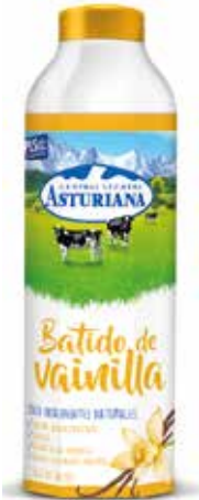
BATIDO VAINILLA C/6 x 1 L. Ref.: 3532