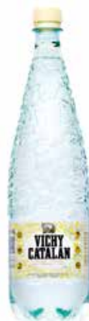
VICHY CATALÁN C/6 x 1'2L Pet. Ref.: 151