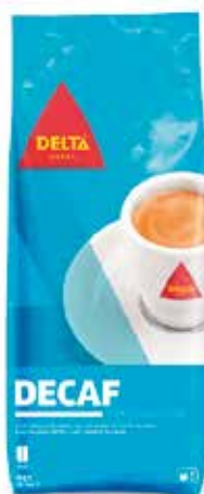
DESCAFEINADO GRANO 1 KG. Ref.: 1979