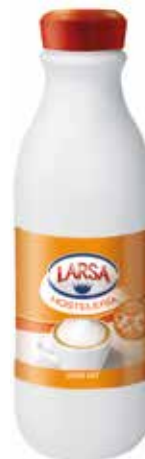
LARSA HOSTELERIA C/6 x 1'5 L. Ref.: 3534