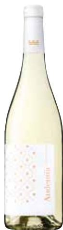
AUDENTIA Chardonnay ref.: 3815