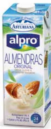
ALMENDRAS C/8 x 1 L. Ref.: 2600