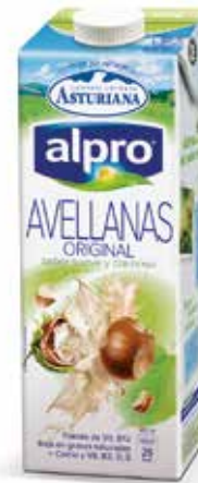
AVELLANAS C/8 x 1 L. Ref.: 3515