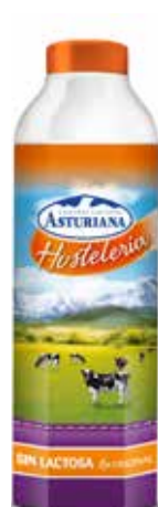
SIN LACTOSA ORIGINAL C/6 x 1 L. Ref.: 3506