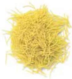
FIDEO 0 Ref.: 3720 - 5 K.