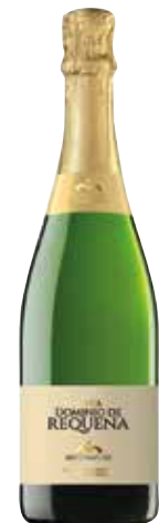
DOMINIO DE REQUENA Brut Nature ref.: 933