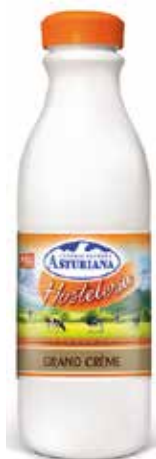
GRAN CRÈME C/6 x 1'5 L. Ref.: 3501