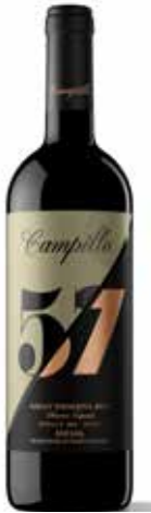
CAMPILLO 57 Gran Reserva ref.: 676