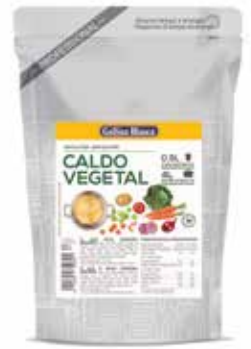
CALDO VEGETAL 0'5 L. Ref.: 3751