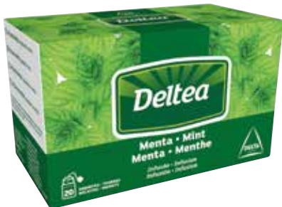
MENTA Estuche 20 bolsitas Ref.: 1969