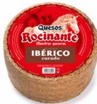
ROCINANTE CURADO Mezcla 3 kg. (vaca, cabra y oveja) 6 meses de maduración Ref.: 268