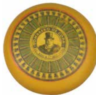
SOMBRERO DE COPA MAASDAM 13 K.