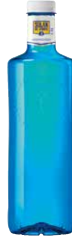
SOLÁN DE CABRAS