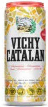
VICHY CATALAN C/24 x lata 33cl Ref.: 2549