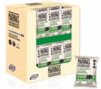
PAPAS VIDAL MARINAS Caja 18 ud. Ref.: 984