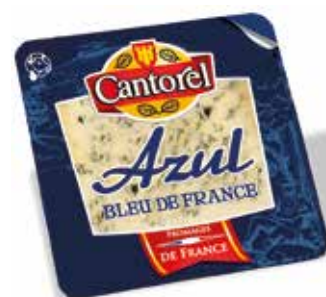
CANTOREL AZUL 100 GRs.