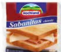
SABANITAS 8 LONCHAS Ref.: 3160