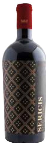
SERICIS Bobal ref.: 5234