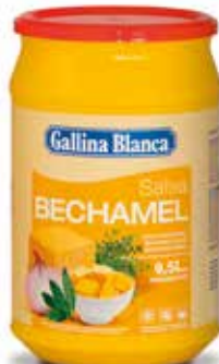
BECHAMEL Ref.: 3714