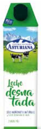
DESNATADA C/6 x 1 L. Ref.: 3510