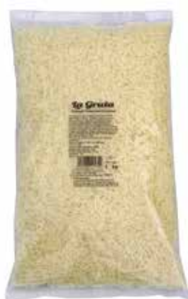
LA GRUTA RALLADO ESPECIAL GRATINAR 1 K. Ref.: 3638