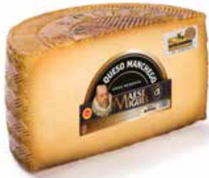
MAESE MIGUEL D.O. MANCHEGO Puro de Oveja 1'5 Kg. 12 meses de maduración Ref.: 2899