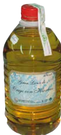
ORUJO DE HIERBAS 3 L. Ref.: 1465