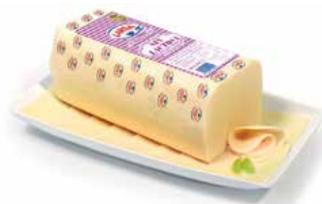
BARRA LARSA SIN LACTOSA 2 K. Ref.: 2936