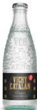
VICHY CATALÁN TÓNICA C/24 x 1/4L Ret. Ref.: 83