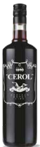
CAFÉ CEROL 1 L. Ref.: 1037