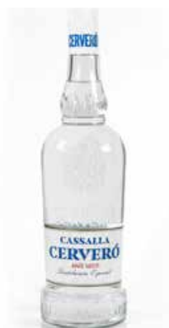
CASSALLA CERVERÓ 1 L. Ref.: 553