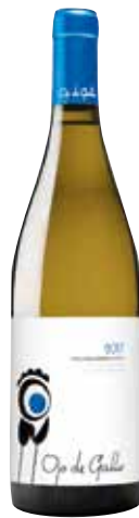
OJO DE GALLO Palomino Fino ref.: 1001