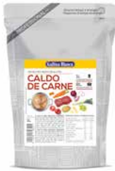
CALDO DE CARNE 1 L. Ref.: 3756