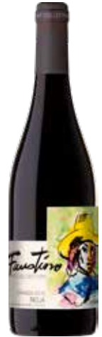
FAUSTINO Art Collection Crianza ref.: 660