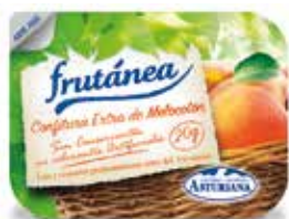
ASTURIANA CONFITURA EXTRA DE MELOCOTÓN C/96 x 20 gr. Ref.: 1844