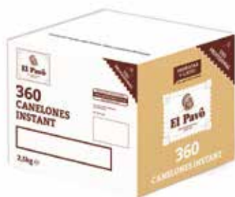
CAJA CANELONES 360 PLACAS Ref.: 3715