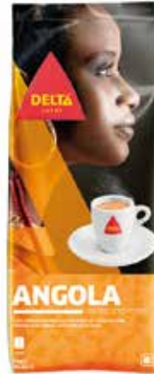
ANGOLA 1 KG. Tueste natural Ref.: 1824