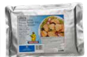
ATÚN LISTADO En aceite vegetal Bolsa 1 K. Ref.: 1535