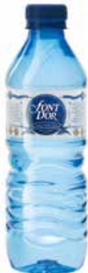
FONT D'OR C/24 x 0'5L Pet. Ref.: 1013