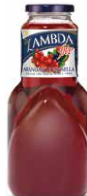
LAMBDA ARÁNDANOS C/24 x 0'2 NR. Ref.: 2308