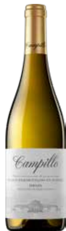
CAMPILLO Blanco Fermentado en barrica D.O. Rioja ref.: 675