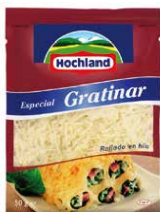
HOCHLAND GRATINAR 50 G Ref.: 3136