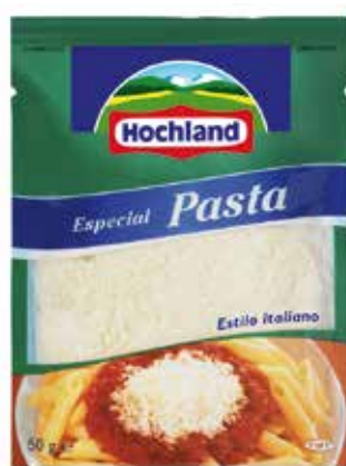
HOCHLAND PASTA 50 G Ref.: 3138