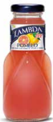
LAMBDA POMELO C/24 x 0'2 NR. Ref.: 2312