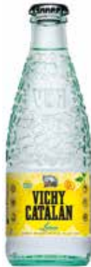
VICHY CATALÁN LIMÓN C/24 x 1/4L NR. Ref.: 193