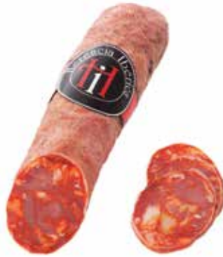
CHORIZO IBÉRICO Ref.: 3242