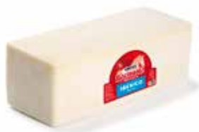
ROCINANTE TIERNO BARRA Mezcla 3 kg. (vaca, cabra y oveja) 10 días de maduración Ref.: 267