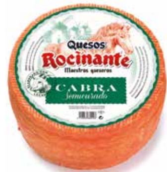
ROCINANTE CABRA SEMI 3 kg. 30 días de maduración Ref.: 1145