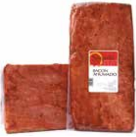
BACON Ref.: 3226