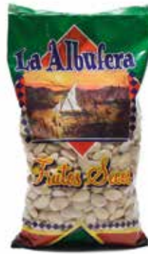
ALMENDRA PELADA Ref.: 5041