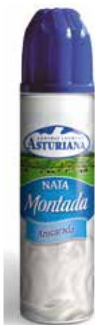
ASTURIANA NATA SPRAY 500 Grs. C/12 x 500 Ref.: 3531