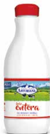
ENTERA C/6 x 1'5 L. Ref.: 3599