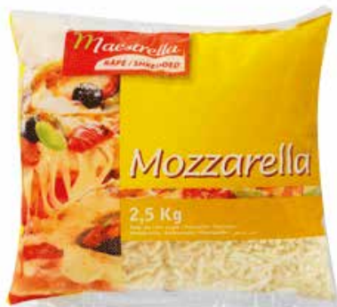
MAESTRELLA MOZZARELLA RALLADA 2'5 K. Ref.: 2336