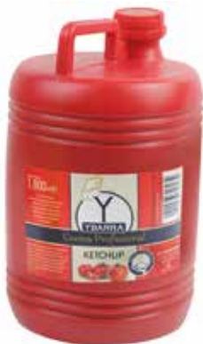
KETCHUP 1'8 L. Ref.: 1667