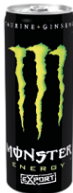
EXPORT MONSTER C/24 x 0'25 Ref.: 220