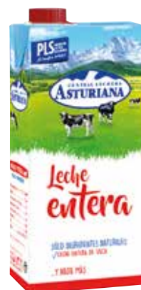
ENTERA C/6 x 1 L. Ref.: 2049