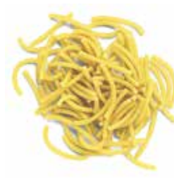
FIDEO PERLA Ref.: 3723 - 5 K.