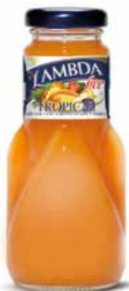
LAMBDA TROPICAL C/24 x 0'2 NR. Ref.: 2306