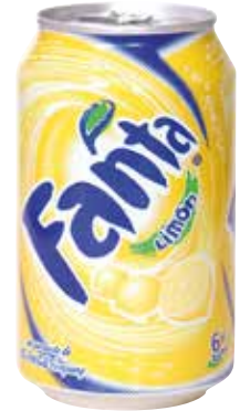
FANTA LIMÓN C/24 x lata 33cl. Ref.: 816