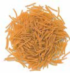
FIDEO 4 Ref.: 3722 - 5 K.