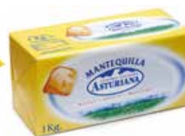
MANTEQUILLA PASTILLA 1 K. Ref.: 3528