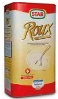
ROUX BLANCO GRANULADO 1 KG. Ref.: 3739