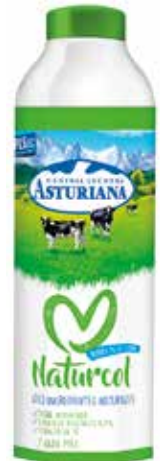
NATURCOL C/6 x 1 L. Ref.: 3518