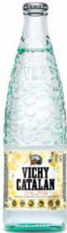
VICHY CATALÁN C/20 x 1/2L Ret. Ref.: 219