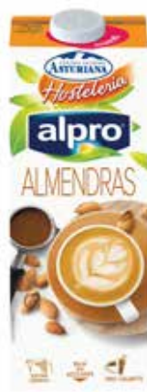
ALMENDRAS C/6 x 1 L. Ref.: 3106