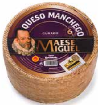
MAESE MIGUEL D.O. MANCHEGO Puro de oveja 3 Kg. 6 meses de maduración Ref.: 271