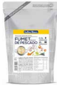
FUMET PESCADO BLANCO 0,5 L. Ref.: 3710