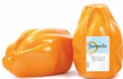
PECHUGA PAVO Ref.: 3424