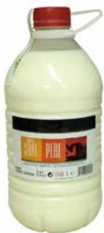
CREMA DE ARROZ 3 L. Ref.: 1560