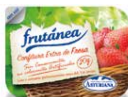
ASTURIANA CONFITURA EXTRA DE FRESA C/96 x 20 gr. Ref.: 1843