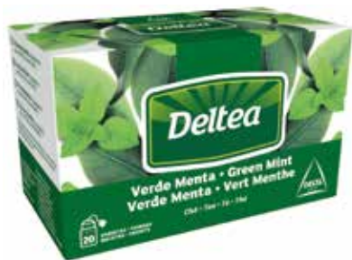
TE VERDE Estuche 20 bolsitas Ref.: 920