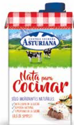
NATA COCINAR 18% C/12 x 0'5 L. Ref.: 3543