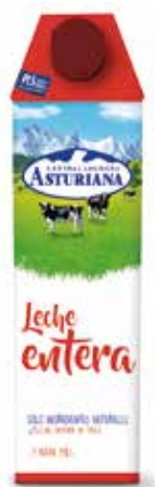
ENTERA C/6 x 1 L. Ref.: 3508