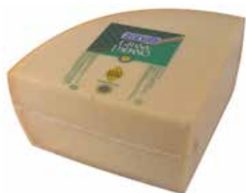
GRANA PADANO 4 K.