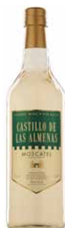
MISTELA CASTILLO DE LAS ALMENAS 0'75 L. Ref.: 5250