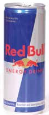
RED BULL C/24 x 0'25 Ref.: 2044