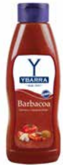
SALSA BARBACOA 1L. Ref.: 3759