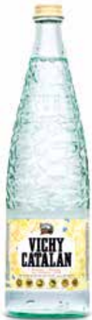
VICHY CATALÁN C/12 x 1L Ret. Ref.: 71 C/12 x 1L NR. Ref.: 187