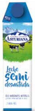
SEMI C/6 x 1 L. Ref.: 3509