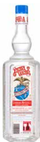
ANIS TENIS 1 L. Ref.: 554