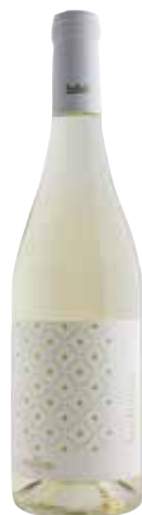
AUDENTIA Sauvignon Blanc ref.: 3801