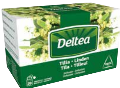
TILA Estuche 20 bolsitas Ref.: 931