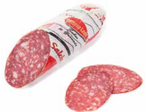
SALCHICHÓN MILENA Ref.: 1304