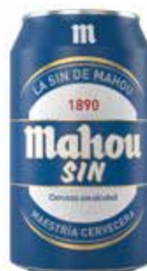
MAHOU SIN C/24 x lata 33 cl. Ref.: 581