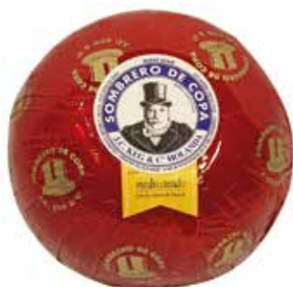
SOMBRERO DE COPA MEDIO CURADO 1'8 K.