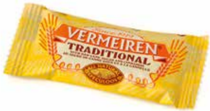
GALLETA SPECULOOS Caja 300 unidades Ref.: 2462