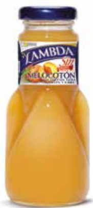
LAMBDA MELOCOTÓN C/24 x 0'2 NR. Ref.: 2314