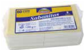
SABANITAS LONCHAS 1 K. Ref.: 3162