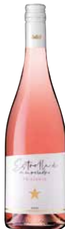
ESTRELLA DE MURVIEDRO Frizzante Rosado ref.: 5061