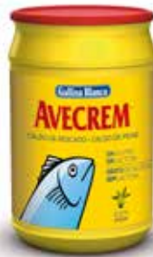
AVECREM 1 KG. PESCADO Ref.: 3750