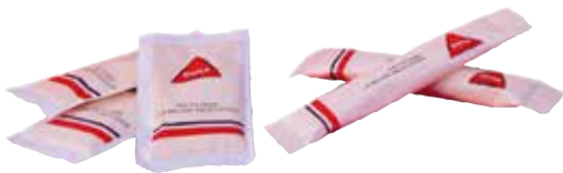
AZÚCAR SELECCIÓN SOBRE Caja 1200 sobres 7 grs. - Ref.: 417 Caja 1000 stick 7 grs. - Ref.: 418 Caja 500 stick 8 grs. Azúcar moreno - Ref.: 419