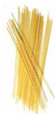
SPAGUETTI Ref.: 3717 - 6 K.