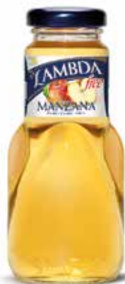
LAMBDA MANZANA C/24 x 0'2 NR. Ref.: 2310