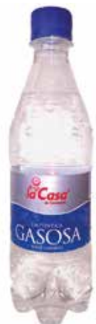
LA CASA C/12 x 0'5 Pet Ref.: 1462