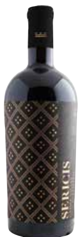
SERICIS Monastrell ref.: 5271

D. O. VALENCIA • D.O. UTIEL-REQUENA • D.O. ALICANTE