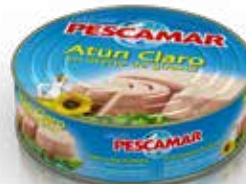
ATÚN CLARO En aceite vegetal RO-1000 Ref.: 1215