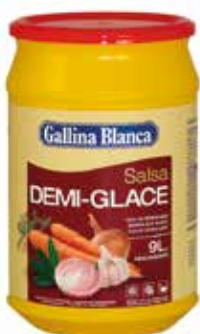
DEMIGLACE Ref.: 3713