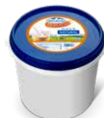
ASTURIANA YOGUR NATURAL 5 K. Ref.: 2178