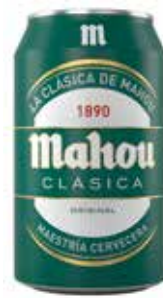
MAHOU CLÁSICA C/24 x lata 33 cl. Ref.: 491