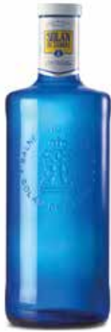
SOLÁN DE CABRAS