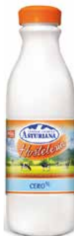
CERO % C/6 x 1'5 L. Ref.: 3576