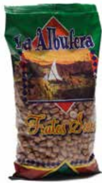
CACAHUETE MONDADO CRUDO 1 Kg. Ref.: 5039