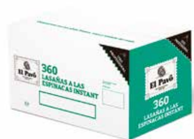
CAJA LASAÑA ESPINACAS 360 PLACAS Ref.: 3741