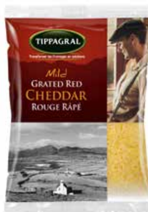
CHEDDAR RALLADO 1 K. Ref.: 256