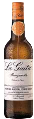
LA GUITA Manzanilla ref.: 1274