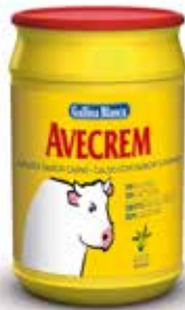
AVECREM 1 KG. CARNE Ref.: 3814