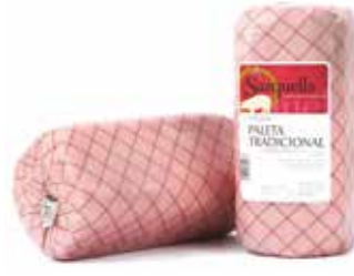
PALETA TRADICIONAL 11x11 Ref.: 3225