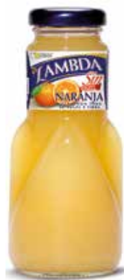
LAMBDA NARANJA C/24 x 0'2 NR. Ref.: 2315