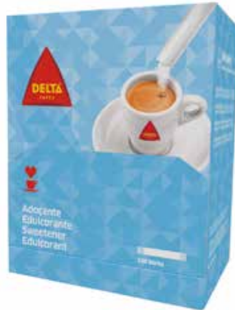
SACARINA SELECCIÓN Estuche 250 sobres Ref.: 976