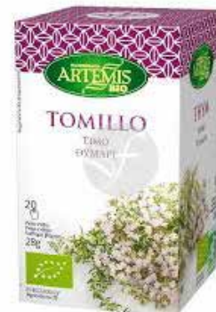
TIMONET Estuche 20 bolsitas Ref.: 1344