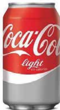
COCA-COLA LIGHT C/24 x lata 33cl. Ref.: 1156