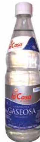
LA CASA GASEOSA C/20 x 0'5 Ret Ref.: 2383