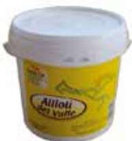
ALLIOLI DEL VALLE 2 L. Ref.: 1638