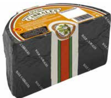
CABRALES 1/2 PIEZA 1'5 K.