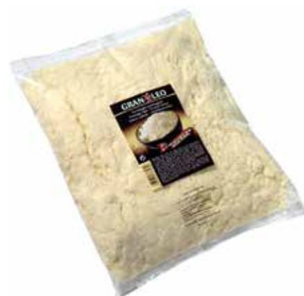
GRAN LEO RALLADO 1 K. Ref.: 3602