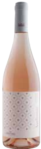
AUDENTIA Cabernet Sauvignon Rosé ref.: 3805