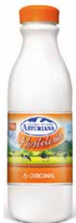
ORIGINAL C/6 x 1'5 L. Ref.: 3500