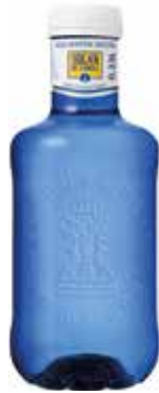
SOLÁN DE CABRAS