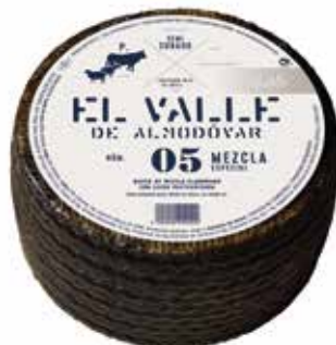
EL VALLE SEMI Mezcla 3 kg. Ref.: 1853