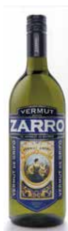
ZARRO VERMUT BLANCO 1L. Ref.: 3764