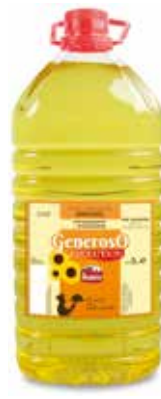
GENEROSO GIRASOL EVOLUTION 5 L. Ref.: 1681