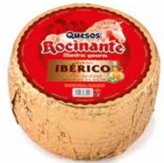
ROCINANTE CURADO EN ACEITE Mezcla 3 Kg. (vaca, cabra y oveja) 9 meses de maduración Ref.: 274