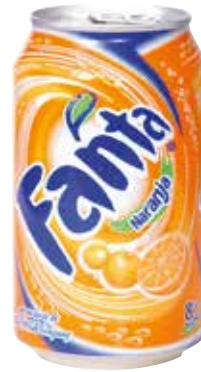
FANTA NARANJA C/24 x lata 33cl. Ref.: 815