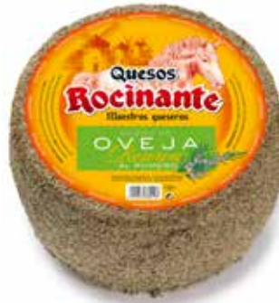
ROCINANTE AL ROMERO Puro de Oveja 3 kg. 6 meses de maduración Ref.: 270