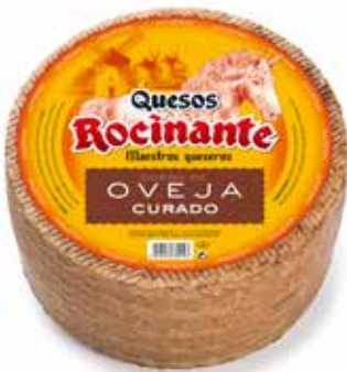
ROCINANTE PURO OVEJA 3 kg. 6 meses de maduración Ref.: 269