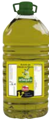
ARBEQUINO ORUJO DE OLIVA 5 L. Ref.: 1683