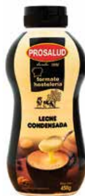
LECHE CONDENSADA SIRVEFACIL 450 Grs. Caja 12 unidades Ref.: 2020