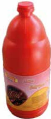
SALSA BARBACOA 2 L. Ref.: 1910