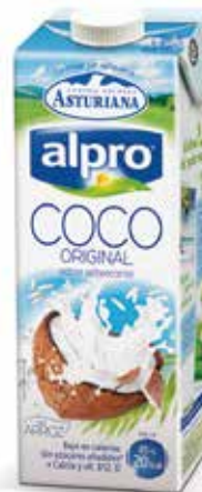
COCO C/6 x 1 L. Ref.: 3517