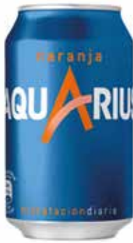
AQUARIUS NARANJA C/24 x lata 33cl. Ref.: 1266