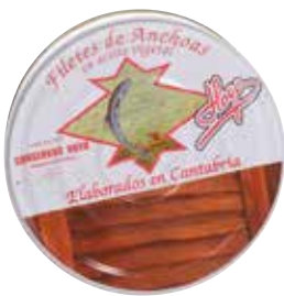
ANCHOA HOYO En aceite vegetal lata RO-550 Ref.: 1577